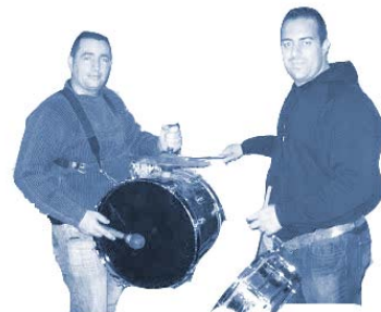
Base rítmica típica con su bombo, sus platillos y su caja

¿Te gustaría tocar alguno de estos instrumentos?