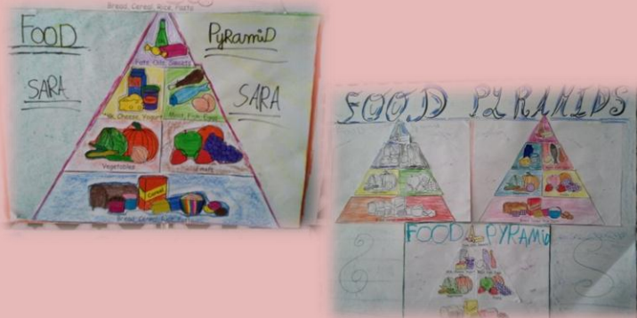
Algunas de las Pirámides Alimenticias