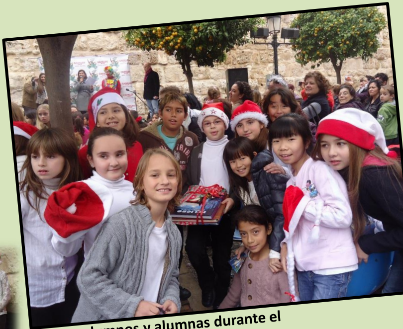
Nuestros alumnos y alumnas durante el concurso de Villancicos

La clase de 5º de Primaria participó con un Villancico en Inglés titulado "We wish you a Merry Christmas" y una selección de alumnos y alumnas de 3º, 4º y 5º de Primaria interpretó un Villancico a dos voces titulado "Blanca Navidad", que resultó premiado cómo el "Mejor Villancico Tradicional" del concurso.